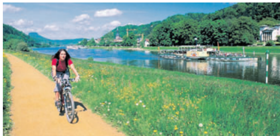
Auch auf dem Elberadweg geht es ständig bergab – vorausgesetzt natürlich, man radelt in Richtung Nordsee.